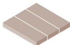
Met 2 lengtegroeven