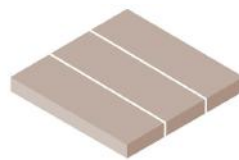
Met 2 lengtegroeven Incl. kopse kanten bovenblad