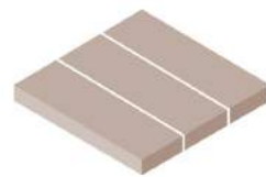
Met 2 lengtegroeven