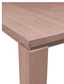
Keep 2 cm