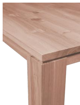
Keep 1 cm